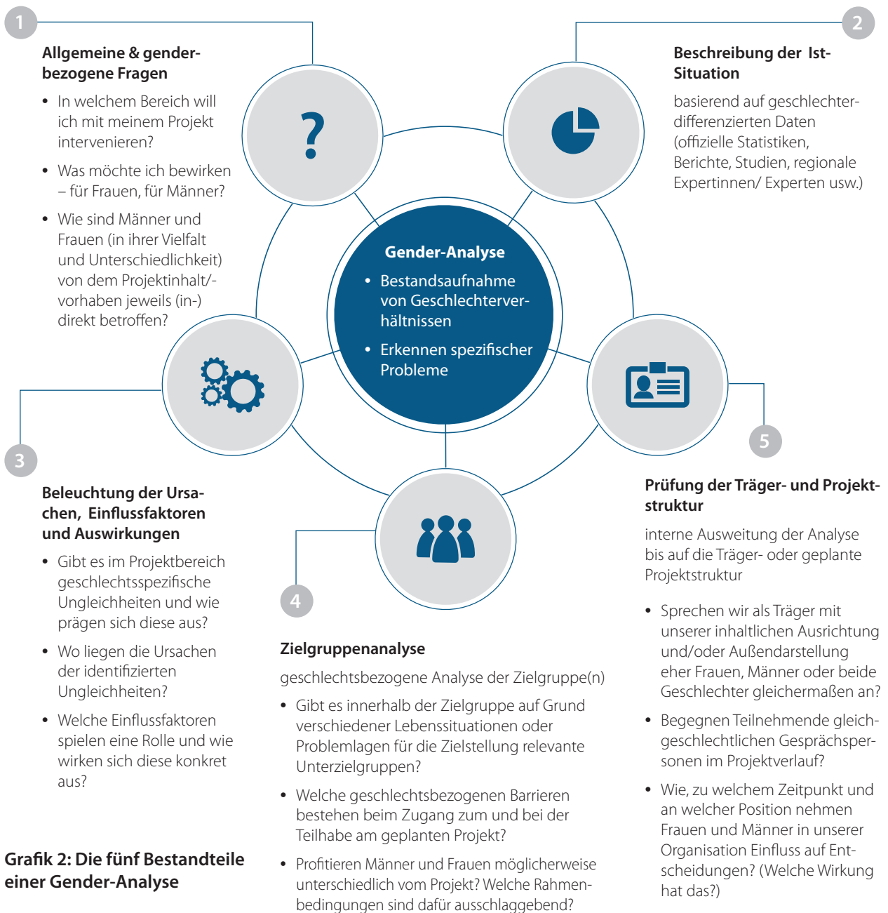
Grafik 2: Die fünf Bestandteile einer Gender-Analyse

Gender-Analysen dienen einer Bestandsaufnahme der Geschlechterverhältnisse und zeigen Zusammenhänge von Ungleichheiten und somit von Diskriminierungen im Projekt- bzw. Interventionsbereich auf. Als Resultat hieraus können spezifische Probleme erkannt und im weiteren Gender-Mainstreaming-Prozess Zielvorstellungen formuliert werden. Dies soll dazu beitragen, die Potenziale von Männern und Frauen besser zu nutzen.